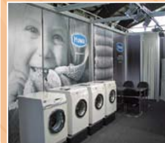
Standkonzept Huwa Gontenschwil

Ihr neues Standkonzept bereitet Ihnen Kopfzerbrechen? Wir beraten Sie gerne und zeigen Ihnen neue Ideen auf!