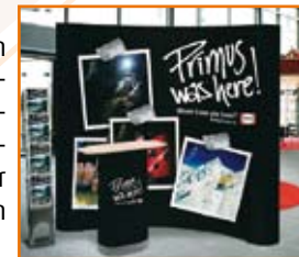
Pop-up und Pop-up-tower