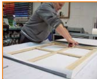
Montage von bedruckter Leinwand auf Keilrahmen

Wir passen all Ihre Motivwünsche auf das gewünschte Format an. Mit unserem Spezialfotodrucker produzieren wie Ihre Bilder auf Leinwand und spannen die Keilrahmen in unserem Atelier.