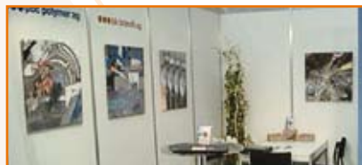
Leinwand-Bilder für Ausstellungswände

Warum nicht Ihren Produktionsablauf einmal auf Leinwand drucken? Mit einer Foto-Leinwand-Serie Ihr Produkt beim Empfang in Szene setzen? Oder im Besprechungszimmer, in der Kantine, im Ausstellungsraum ...?